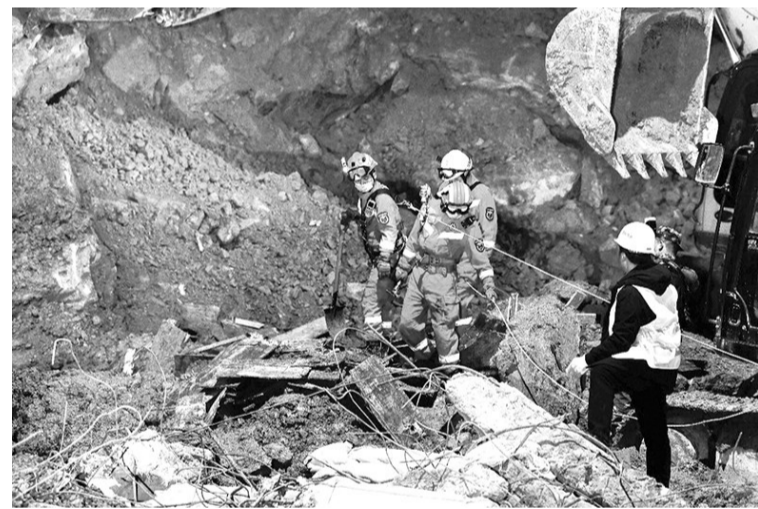
贵州毕节在建工地山体滑坡造成5人遇难9人失联

近年来,为提升海上风电输电设备国产化、自主化能力,衡变全面启动海上风电输电设备研发工作,专项开发海岛型预制舱式变电站技术、风机内置塔筒变压器及开关柜、海上升压平台输电设备关键技术、柔性直流输电技术等海上风电输电技术,实现关键一次设备的集成和工程运用。2019年,衡变研发团队启动海上风电塔筒变压器研制项目,采用船舶防腐工艺技术、高燃点的环保型合成酯油以及H级绝缘,实现塔筒变压器关键技术突破。最终成型装备,一次性通过全部型式实验,经专家现场联合评审,认为其达到了国际领先水平。