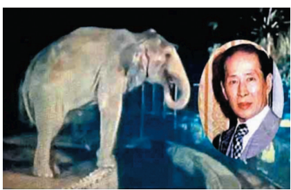
大象可憐，老倌可愛！

最後T叔笑說，粵劇最出名的大老倌倒在荔園也看過一個，不過並不是在舞台上，而是在舞台下，有晚他進場之前，看到門前一輛大房車打開車門，走出西裝筆挺腳踏黑白皮鞋的「慈善伶王」新馬仔（新馬師曾），施施然進場時竟然不得其門而入，原來售票員堅持要他買票，新馬仔為此生氣，雙方有了爭執，原來當晚他小姨洪國華園內有表演，他為捧場而來，可是售票員公事公辦，不肯因為他有頭有臉而賤賣，不買票就不開關，大家僵持了幾分鐘，最終伶王還是忍住一肚子氣買了票，盡忠職守的可愛售票員，不知事後有沒有加薪？