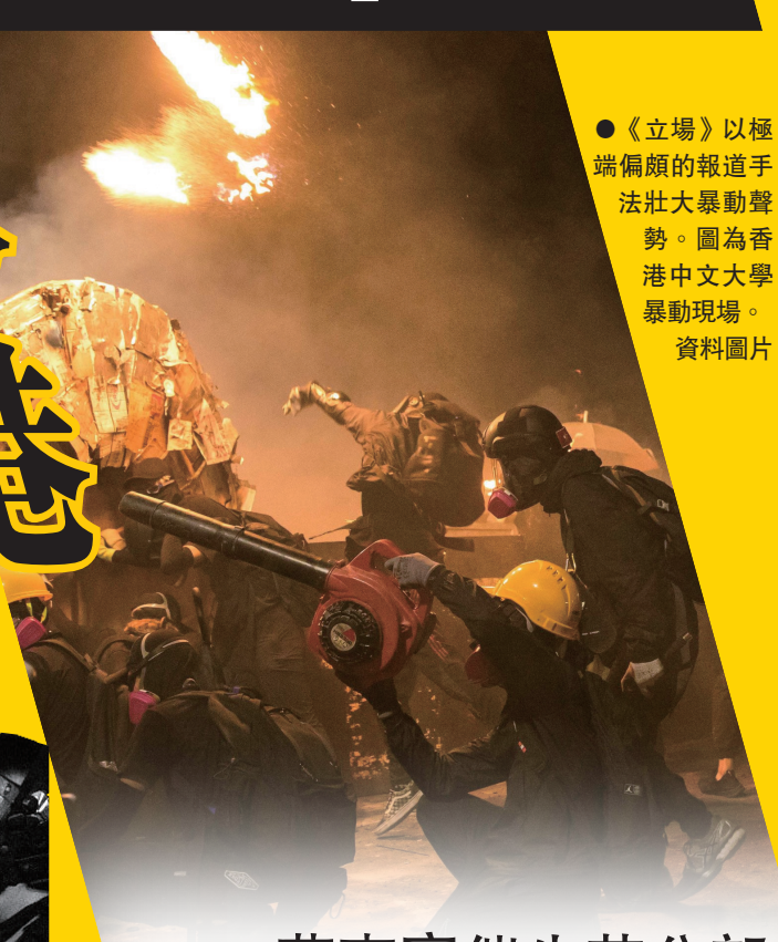
●《立場》以極端偏頗的報道手法壯大暴動聲勢。圖為香港中文大學暴動現場。