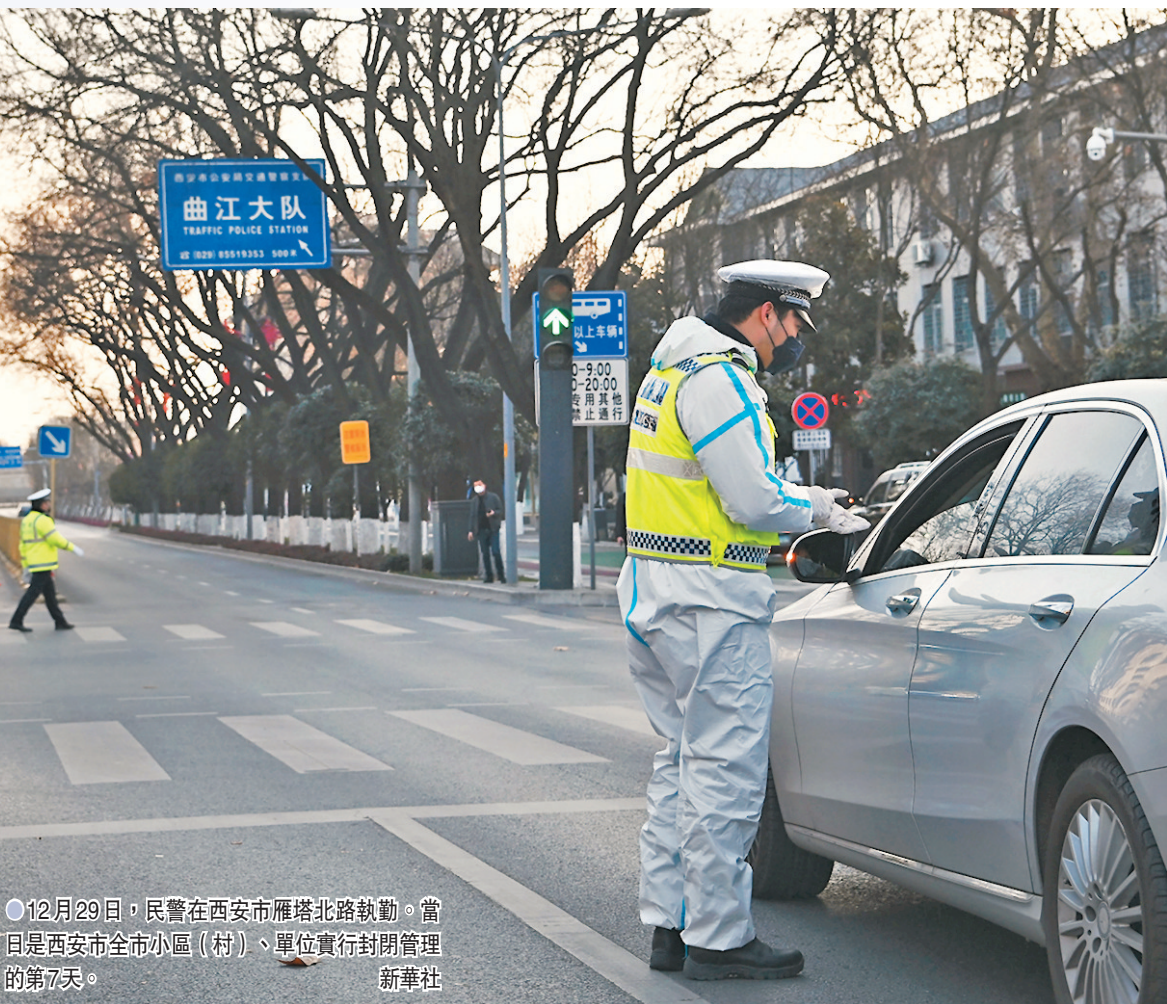
○12月29日，民警在西安市雁塔北路執勤。當日西安市全市小區（村）、單位實行封閉管理的第7天。新華社

賀青華表示，當前內地疫情呈現局部高度聚集且全國多點散發的情況。內蒙古滿洲里的相關疫情已連續11天沒有新增，疫情基本得到控制。浙江、江蘇、上海的關聯疫情新增散發病例均在集中隔離點發現，風險也基本控制。陝西西安疫情目前處於快速發展階段，且病例有外溢到省內和省外的情况，風險人員排查和管控措施需要進一步加強，後續疫情在社區傳播風