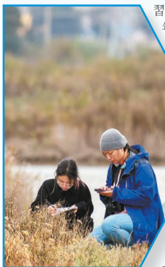
南科學子在鄉野的田埂上調查黑臉琵鷺的棲息地

「國家自然科學基金傑出青年基金」獲得者39人、「國家自然科學基金優秀青年基金」獲得者24人。教學科研系列教師90%以上具有海外工作經驗，60%以上具有在世界排名前100名大學工作或學習的經歷，師資隊伍中高層次人才佔比超過40%。