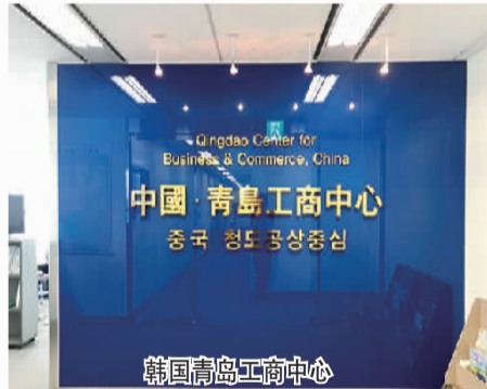
韩国青岛工商中心