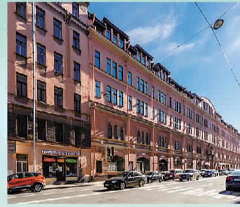
俄罗斯青岛工商中心