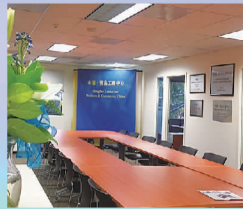
美国青岛工商中心