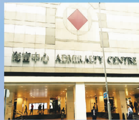
中国香港青岛工商中心