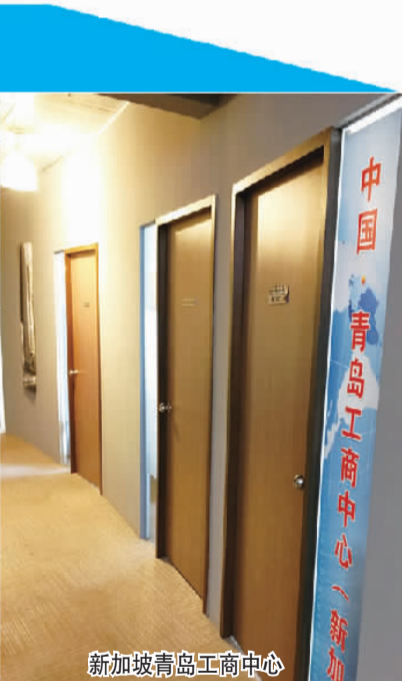
新加坡青岛工商中心