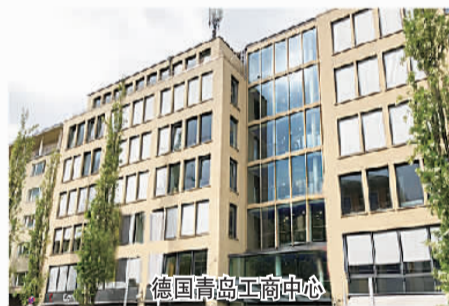
德国青岛工商中心