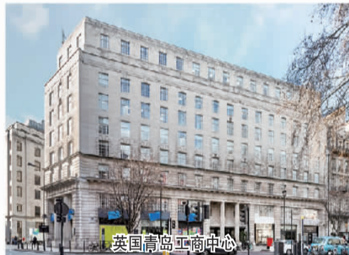
英国青岛工商中心