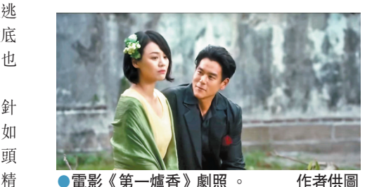
電影《第一爐香》劇照。

電影營造出的亂世氛圍，較文字更直率濃烈。主場景的花園，本來清新翠綠，氤氳在水漬裏的粉霧。