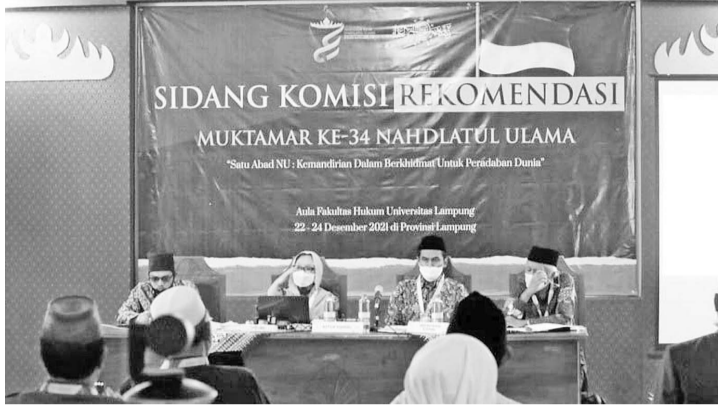
第34届伊联全体领导人大会

【本报讯】伊斯兰教士联合会(伊联/NU)要求政府与国会立即修订刑事法典。这是伊联在楠榜(Lampung)举行第34届伊联全体领导人大会作出的其中一项决议。