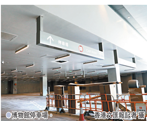
● 博物館停車場。