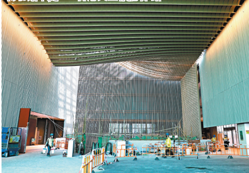
● 博物館裝修工程如火如荼，圖為博物館中庭。

不過吳志華強調，票價必定要合理及市民可承擔，不應高於主題樂園入場費，絕不會令一些長者、低收入人士因無法負擔門票而被拒諸門外，該館也正研究一些措施，鼓勵弱勢社群入場，但這方面需要社會更多力量支持，現正與一些機構商討冀獲他們支持推出活動，令更多有需要人士受惠。