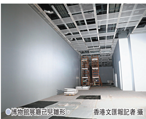
● 博物館展廳已見雛形。香港文匯報記者攝