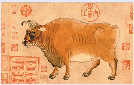
● 北京故宮博物院將借出逾900多件文物珍品在港展出，圖為《五牛圖》(局部)。