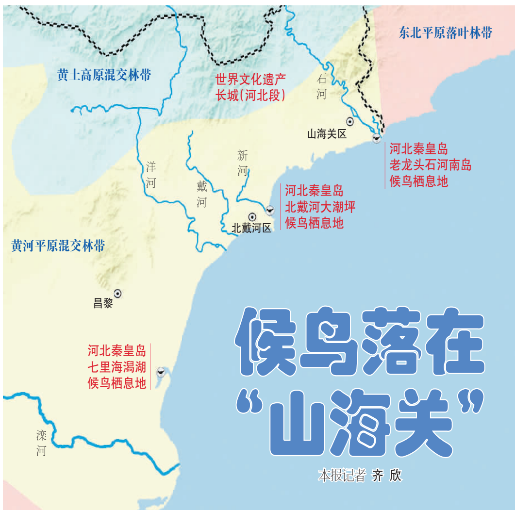
秦皇岛地区重要候鸟栖息地及地理环境示意图。(制图：顾焱芸 底图来源：国家地理信息公共服务平台)