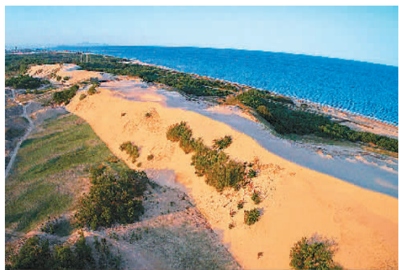
七里海潟湖与海面间横亘着数千米长的高大沙丘。

在潮流作用下，可以冲开坝体，形成潮汐通道。涨潮流带入潟湖的泥沙，在通道口内侧形成潮汐三角洲。潟湖沉积是由入潟湖河流、海岸沉积物和潮汐三角洲物质充填，往往形成有黑色有机质粘土与贝壳碎屑等沉积物。