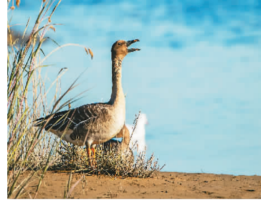
2021年11月，在大潮坪记录到的丑雁。

2020年6月，国家发展改革委、自然资源部印发《全国重要生态系统保护和修复重大工程总体规划(2021-2035年)》。其中“海岸带生态保护和修复重大工程”涉及河北等11个省(区、市)的近岸近海区，涵盖黄渤海、东海和南海等重要海洋生态系统。“海岸带”区域是我国经济最发达、对外开放程度最高、人口最密集的区域。“海岸带”工程提出：推进“蓝色海湾”整治，开展退堤还海还滩、岸线岸滩修复、河口海湾生态等工程建设，维护海岸带重要生态廊道，保护生物多样性。