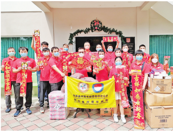
世泉青印尼分会暨印尼泉州青年商会一行人在养老院前合影

问老人,为老人们送温暖,献爱心,是该会将这个优良传统在印尼传扬和实践。本会将积极主动的做一些有意义的活动,每年将会通过不同的活动方式来回馈社会,将爱心继续发扬继承,向社会传播正能量,为印中友