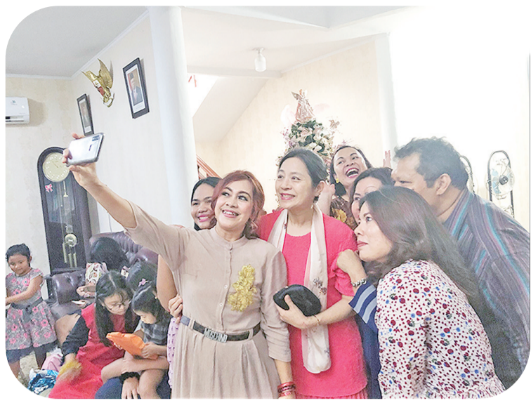
国人同舟共济的深厚情谊。

征程。在习近平主席和佐科总统的战略引领下，中国与印尼两国政府、政党、立法机构等各方面交往日益密切，政治互信不断增强。双方深入对接“一带一路”倡议与“全球海洋支点”构想，两国友好关系在不平凡的形势下取得显著进展。领区内多个经贸合作项目获得良好效益，对华贸易额逐年增加，橡胶、棕榈油、咖啡、燕窝、水果等优质产品对华出口势头强劲。双方人文交流特别是领区内华文教育蓬勃发展。广州市与占碑市成功结为友好城市。疫情暴发后，中印尼两国人民守望相助，相互支持，共同抗击新冠肺炎疫情，生动诠释了中印尼人民推动构建人类命运共同体的精神。特别是领区华人华社和中资企业积极支持祖(籍)国抗疫斗争，中国广东省、成都市等省市分别向苏北省、棉兰市等领区友城捐赠抗疫物资，充分显示了