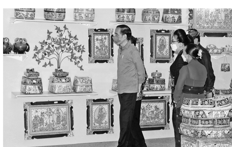
佐科维总统视察巴厘中小企展览会 12月27日,佐科维总统在巴厘省登巴利市 Werdhi 文化艺术中心,视察中小企业展览会中所展示的手艺作品。