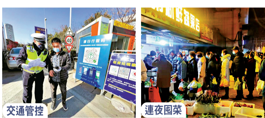
●12月21日，市民在西安市柏樹林街道三學街社區核酸檢測點排隊等待核酸檢測。新華社 ●西安交管部門在高速路口等加強查驗，對非必要離市人員進行勸退。記者 李陽波 攝 ●22日晚，部分西安市民湧進菜場商超搶購食品物資。記者 李陽波 攝