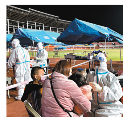
●22日8時起，與越南接壤的廣西東興市全市實行居家隔離管理。圖為東興發現陽性病例後，隨即全市啟動應急響應，實行全員核檢。

東興市疫情防控指揮部提醒已通過東興口岸入境預約平台成功預約的人員，如已前往（到達）越南芒街市，可以選擇入住芒街市隔離酒店，待恢復東興口岸正常通關後按預約順序安排入境。