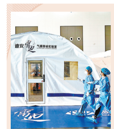
氣膜實驗室啓用 12月22日，在位於陝西西安的西安國際會展中心內，兩套用於核酸檢測的氣膜實驗室正式啓用，每日最高檢測產能可達25萬管。圖為工作人員從實驗室前走過。