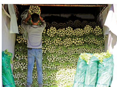
●西安西部欣橋農產品物流中心內，商戶正在打包蔬菜。

香港文匯報訊 據西安日報報道：記者從市商務局獲悉，截至12月18日，西安已經完成市級2.4萬噸冬春蔬菜的儲備任務。今年冬春