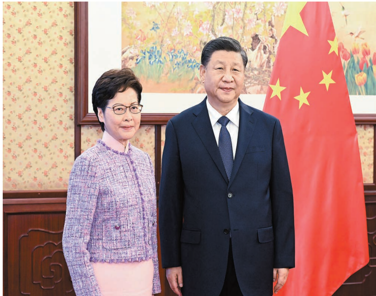
習近平昨日在中南海會見赴京述職的林鄭月娥。

【香港商報訊】記者敖雷、張麗娟北京報道：國家主席習近平昨日下午在中南海瀛台會見來京述職的香港特區行政長官林鄭月娥，聽取她對香港當前形勢和特別行政區政府工作情況的匯報。習近平對林鄭月娥和特別行政區政府的工作給予了充分肯定，並指出，在新選舉制度下，香港特別行政區選舉委員會選舉和第七屆立法會選舉先後舉行，都取得了成功，證明新選舉制度是一套好制度。