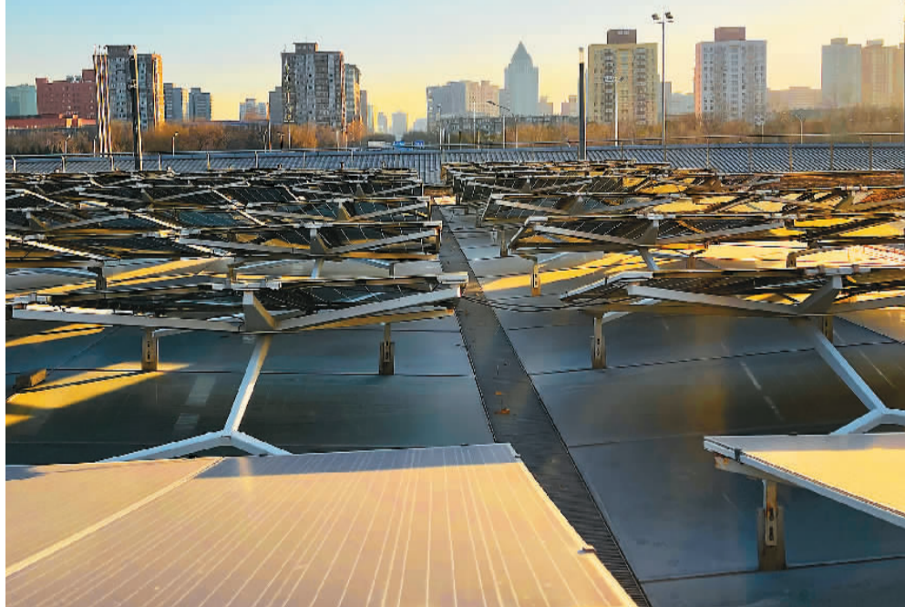
北京冬奥会场馆建设和能源供应是成功举办冬奥会的重要基础和保障。北京冬奥组委与北京市、河北省政府紧密合作, 各项措施落实到位, 全部场馆实现城市绿色电网全覆盖。图为北京冬奥村光伏充电桩实施到位。