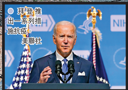
● 拜登推出一系列措施抗疫。