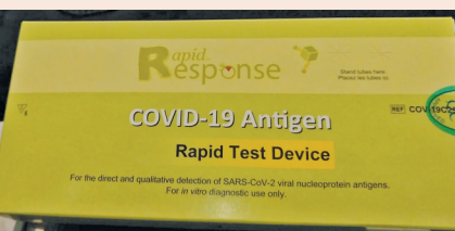
● 加拿大向民眾提供快速檢測工具。