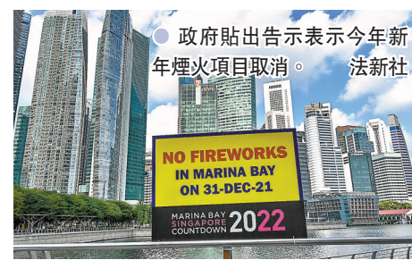
● 政府貼出告示表示今年新年煙火項目取消。