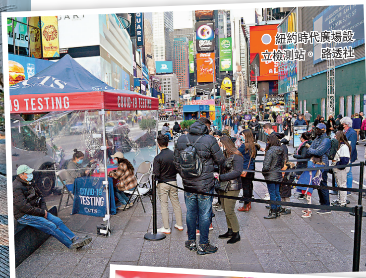
● 紐約時代廣場設立檢測站。