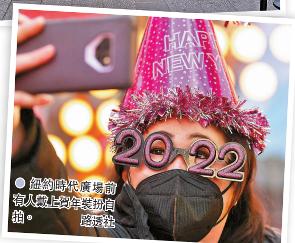
● 紐約時代廣場前有人戴上賀年裝扮自喻。