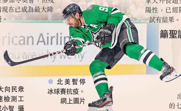
● 北美暫停冰球賽抗疫。網上圖片