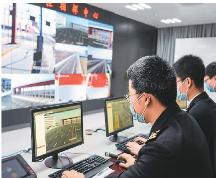
12月20日, 北京大兴国际机场综合保税区(一期)正式通过国家验收。图为在综合保税区监控指挥中心验收现场, 海关关员演示操作监控指挥设备。

新华社北京12月21日电(记者杜海涛)20日, 全国首个也是唯一一个跨省市综合保税区——北京大兴国际