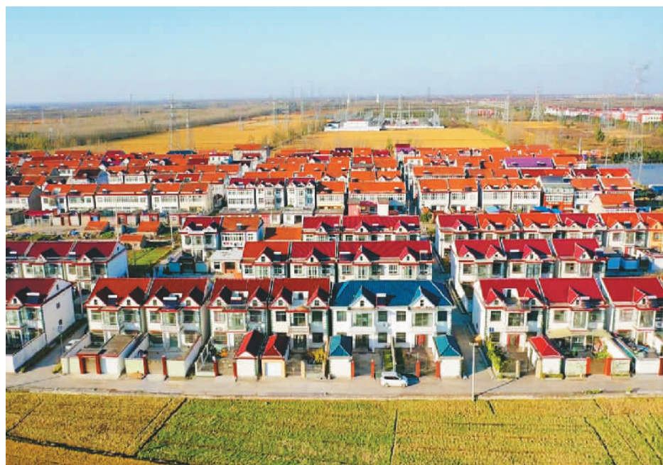
江苏连云港高新区新浦工业园积极改善农村人居环境, 完善农村道路、道路交通、绿化美化、环境保护、公共设施等综合管护体系, 村容村貌焕然一新。图为干净整洁的新浦工业园道口新村。