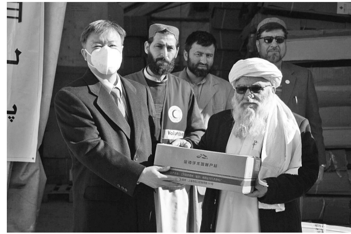
12月21日,在阿富汗喀布尔,中国驻阿富汗大使王愚(前左)和阿红新月会主席哈里斯(前右)出席物资交接仪式。当日,中国红十字会援助阿富汗红新月会物资交接仪式在阿红新月会总部举行。