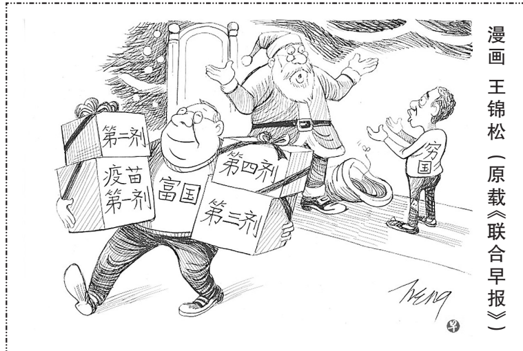
漫画 王锦松(原载《联合早报》)

在国际社会的历史长河中,失德媒体凭空造谣、颠覆事实、操纵舆论、要挟政府的恶劣事迹斑斑可寻。希望民众警惕那些心怀叵测的媒体,希望相关部门进行严格整治。