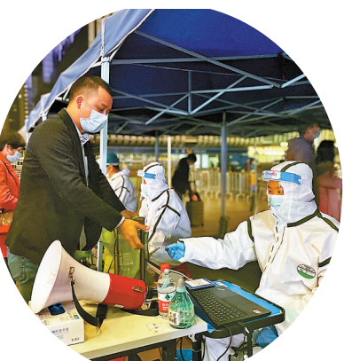
●醫護人員在進行核酸檢測身份信息登記。

「現在馬上要過年了,防疫政策嚴一點也有利於大家安心過節。」江西旅客溫先生20日晚搭乘贛深高鐵抵達深圳北站,從西廣場出站時,除了檢票和驗碼,還一站一式接受了核酸檢測,排隊約20分鐘完成了