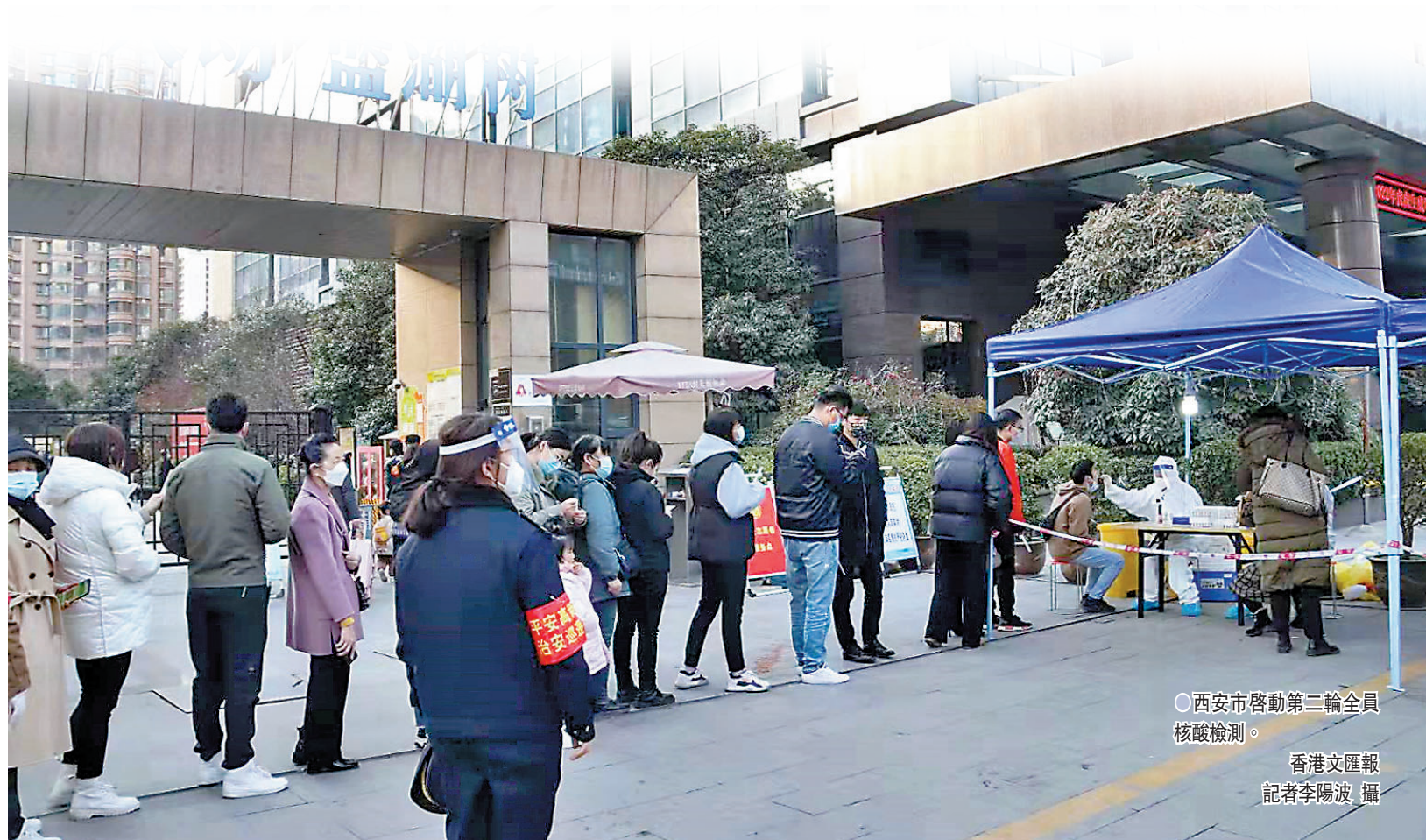
○西安市啓動第二輪全員核酸檢測。

與此同時,西安市中小學、幼兒園、校外培訓機構也全面停止線下教學,安排線上教學,同時開展師生全員健康管理檢測,實行校園封閉化管理,做好居家學生心理輔導,具體復課時間根據疫情防控形勢另行通知。