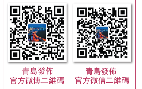
青島發佈官方微博二維碼

另外，青島在2021年還上榜“中國美好生活城市十大向往之城”“中國夜經濟十大影響力城市”“2020年中國最具競爭力會展城市”等。