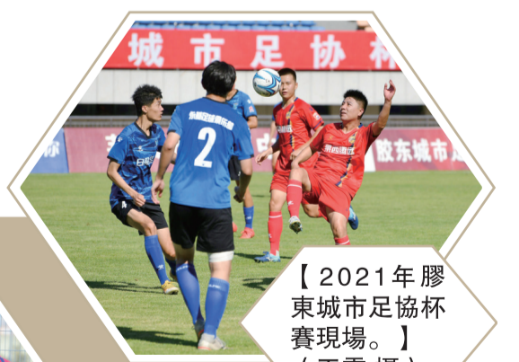
【2021年膠東城市足協杯賽現場。】