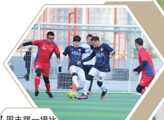
【周末踢一場比賽，成為很多喜愛足球的青島市民的習慣。】