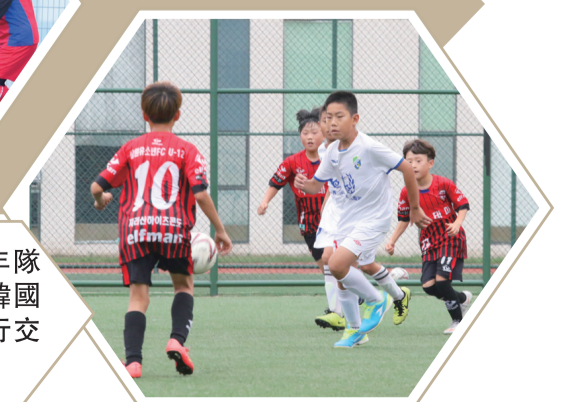
【鯤鵬少年隊與來訪的韓國少年隊進行交流比賽。】