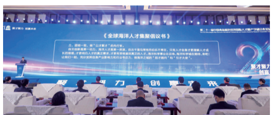
【開幕式上發布了《全球海洋人才集聚倡議書》。】

12月2日，以“聚才聚力 創贏未來”為主題的第二十一屆中國青島藍色經濟國際人才暨產學研合作洽談會在青島西海岸新區舉行。活動現場，13個海外高層次人才和重點項目成功簽約落戶青島。國際歐亞科學院院士李乃勝在開幕式上宣讀了《全球海洋人才集聚倡議書》，向全球海洋領域精英發出“求賢令”。