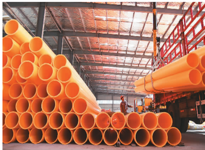
近年来，江苏省连云港市聚力解决中小企业发展需求，营造更加有利于中小企业发展的氛围，促进了中小企业快速发展。图为日前连云港市一家管业公司的工人正将一批MPP电力保护管装车发货。

日前，工业和信息化部等19部门印发《“十四五”促进中小企业发展规划》（简称《规划》），对“十四五”期间促进中小企业发展工作做出部署。工信部有关负责人介绍，《规划》把握中小企业面临的政策机遇、市场机遇、环境机遇和创新机遇，将培育壮大市场主体、构建企业梯度培育体系、提升企业创新能力和专业化水平等作为“十四五”中小企业工作重点。