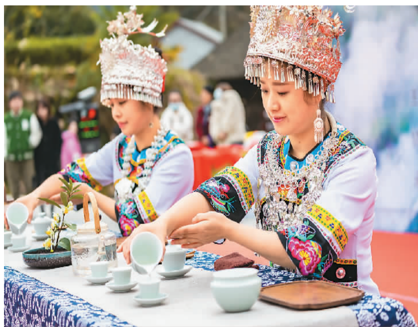
湖南省湘西土家族苗族自治州吉首市大力支持茶旅融合发展，积极打造集种植、加工、观光、品鉴、交易、文化、旅游六位一体的湘西黄金茶茶博园，园区逐渐成为广受青睐的打卡、采风之地。图为日前吉首市举办的茶旅融合采风活动现场。

中国信保相关负责人表示，“十四五”期间，中国信保将努力建设成为负责任、可信赖、具有全球影响力的信用风险管理机构，努力做好逆周期调节的工具、国家风险管理的平台、产业链供应链稳定的保障和中国企业“走出去”的坚强后盾。