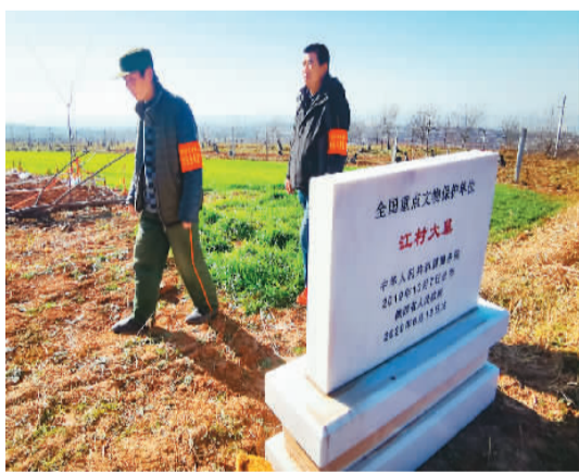
2019年起，“江村大墓”已成为全国重点文物保护单位。

相关专家表示，本次考古工作确定了汉文帝霸陵的准确位置，加上此前确定的长陵、茂陵、渭陵等，解决了西汉11座帝陵的名位问题。霸陵双重陵园、帝陵居中、外藏坑环绕的结构布局，与汉高祖长陵、汉惠帝安陵显示出明显的差异，奠定了西汉中晚期帝王陵墓制度的基础，对中国帝王陵墓制度的深入研究有重要意义。