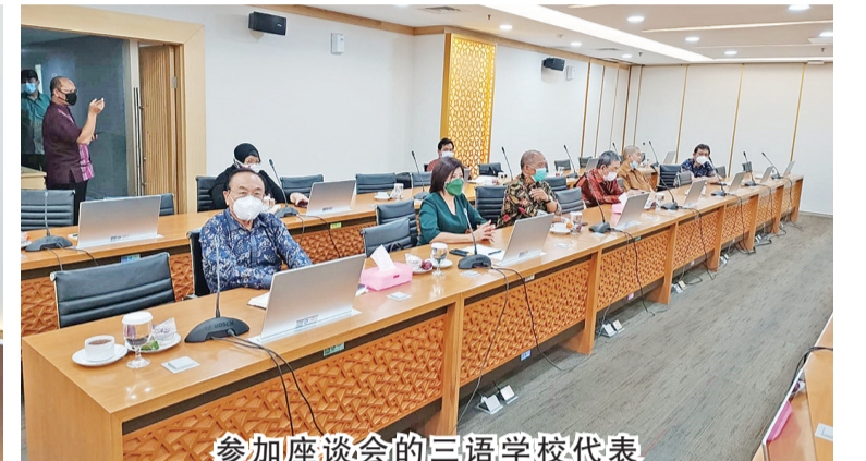
参加座谈会的三语学校代表