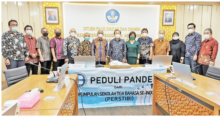
文教部基础教育司官员与三语学校代表合影

【本报讯】12月16日，印尼文化教育、高等教育、科研技术部邀请印尼三语学校协会，于雅加达文教部所在地举办座谈会。