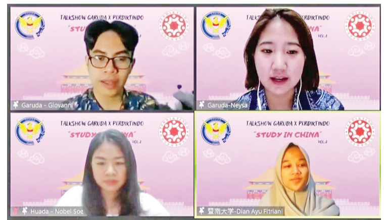
主持人与暨大华大在校生