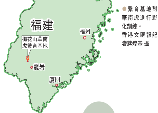
●繁育基地對華南虎進行野化訓練。