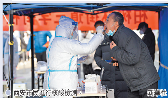
西安市民進行核酸檢測。

通報稱，該兩例新冠病毒奧密克戎變異株感染者為入境閉環管控人員，目前在定點醫院隔離治療。