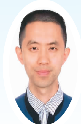
中国现代国际关系研究院军控研究中心主任 郭晓兵