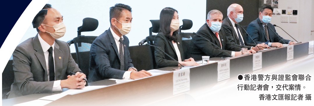
●香港警方與證監會聯合行動記者會，交代案情。

被捕的10人中，有8男1女(25歲至62歲)涉嫌在今年2月至7月間在香港清洗2.9億元黑錢而被捕，包括一名集團骨幹、6名上市公司高層，其餘兩人是傀儡公司戶口持有人。除報稱為商人外，亦有人報稱是財經分析師和補習老師。警方在香港凍結39個銀行戶口內共4,850萬元存款，並檢獲200萬元現金及貴重物品。