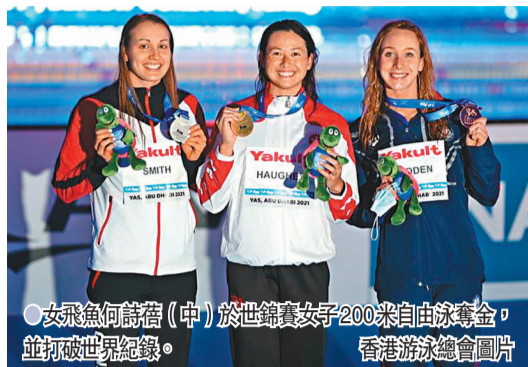
女飛魚何詩蓓(中)於世錦賽女子200米自由泳奪金，並打破世界紀錄。

香港文匯報訊(記者郭正謙)繼東京奧運獨攬兩銀後，女飛魚何詩蓓再次為香港體壇創造歷史，於阿聯酋舉行的游泳短池世錦賽女子200米自由泳項目勇奪金牌，不僅是香港首位世界冠軍泳手，更以1分50秒31打破世界紀錄，成為香港泳壇史上首位世界紀錄保持者，在一年之間三級跳成為世界第一。 何詩蓓早前出戰國際游泳聯賽(ISL)200米自由泳項目未嘗一敗，更多次刷新亞洲紀錄。到世錦賽舞台，她在初賽1分