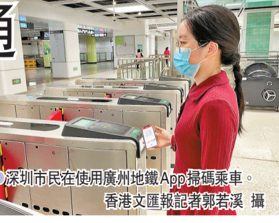
深圳市民在使用廣州地鐵App掃碼乘車。

目前，互聯暫不包含深圳龍華有軌電車，以及廣州有軌電車海珠環島線、黃埔有軌電車1號線、廣清城際鐵路花都站至清城站段以及廣州東環城際鐵路花都站至白雲機場北站段。