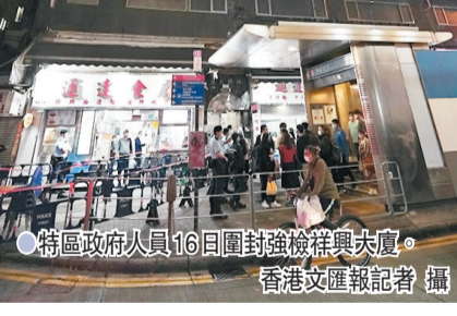
特區政府人員16日圍封強檢祥興大廈。

月9日他離港前檢測結果呈陰性，11日隨國泰貨機前往美國，本周一由美國經航班CX2071返抵香港，抵港時在機場檢測結果呈陰性。由於機組人員獲免檢疫，他同日返回油麻地祥興大廈寓所。