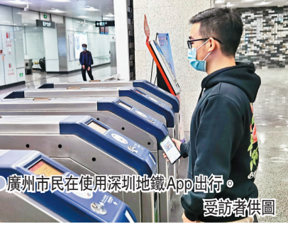
廣州市民在使用深圳地鐵App通行。