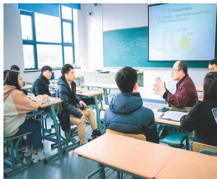
老挝留学生课间与老师讨论问题。