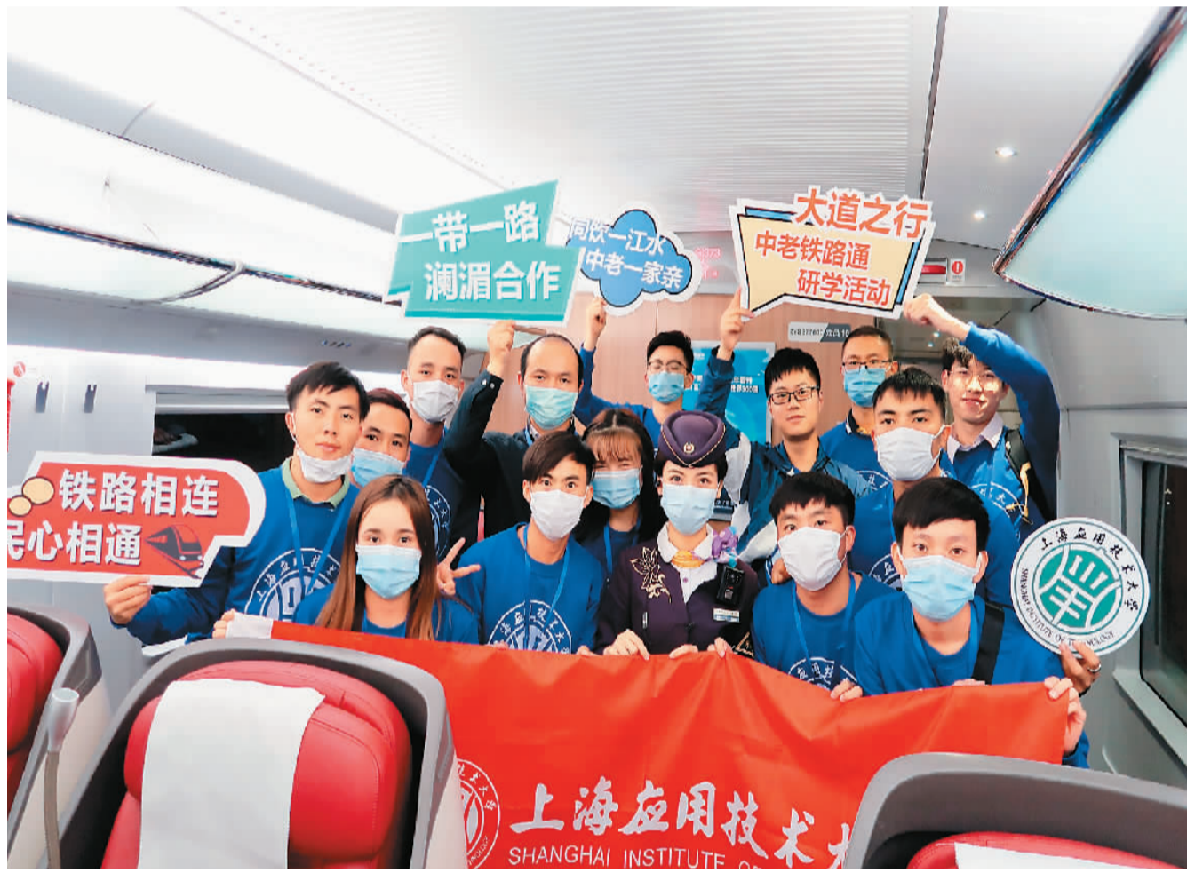
上海应用技术大学老挝留学生参加研学活动并在复兴号高铁列车上留影。

中老铁路通车后，同学们在社交媒体平台转发了视频直播等各种形式的报道，一同见证了这条友谊、科技、绿色、开放的跨国铁路穿山越岭，见证老挝从“陆锁国”变为“陆联国”的梦想成为现实。他们说：“在上海的学习让我们赶上了中国的新时代，世界最先进的铁路从中国走进老挝，也走进了我们每个人的心里。”