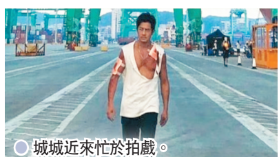
●城城近來忙於拍戲。

據悉，這個跨年演唱會預計耗資3,000萬元製作，透過這次活動，主辦方希望為香港復甦作一個起點，為加強氣氛，整個演唱會的門票收益扣除成本後將予以一個份額捐贈給「香港現場演出及製作行業協會」，幫助疫情期間沒有工作和收入的業內人士。