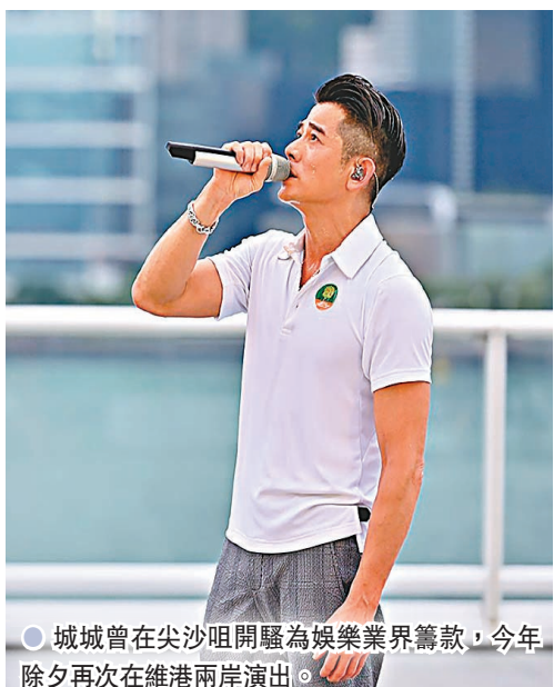
●城城曾在尖沙咀開騷為娛樂業界籌款，今年除夕再次在維港兩岸演出。