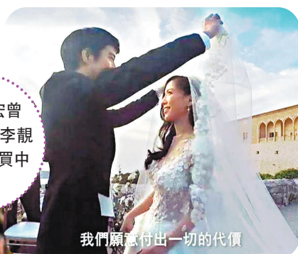
我們願意付出一切的代價

近期王力宏與小10歲的妻子李靚蕾已屢傳出婚變消息，近兩年在社交平台上更鮮有互動。前天傳出兩人婚變消息，王力宏前天下午在社交平台上親自回應兩人婚姻狀態，他表示：「在這些年的婚姻當中我做得不足的地方太多了，也感到很遺憾。現在我們對未來的生活方式有不一樣的想法和規劃，所以決定分開生活。雖然已提出申請，但是我們永遠會是一家人」。他還強調，兩人私生活很簡單、很單純，懇求外界給予隱私與空間，不要打擾家人，謝謝大家關心，也不會再回應任何媒體。