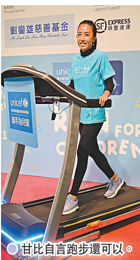
●甘比自言跑步還可以。

快將聖誕節，甘比透露：「因疫情不能外遊，已準備邀請小朋友到屋企開派對，亦已提早送了聖誕禮物給3個仔女，他們已經拆了禮物，並要求再買，(孩子們有送聖誕禮物給你嗎?) 每天都有送，全都是他們的畫作，感覺好sweet。」