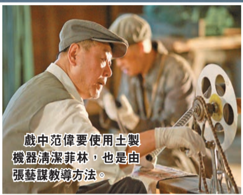
戲中范偉要使用土製機器清潔菲林，也是由張藝謀教導方法。