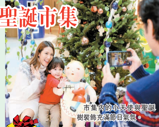
市集內的小天使與聖誕樹裝飾充滿節日氣氛。