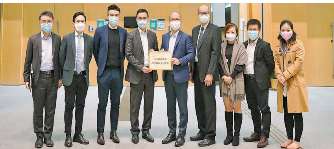
香港教育工作者聯會及香港教育工作者工會代表會晤楊潤雄反映意見。

【香港商報訊】記者萬家成報道：香港教育工作者聯會聯同香港教育工作者工會代表昨日會晤教育局局長楊潤雄，就教師身心健康、學生人口下跌、小學中層人手及薪酬架構等議題進行交流，反映意見。雙方會面氣氛良好，局方亦就多項建議積極回應。