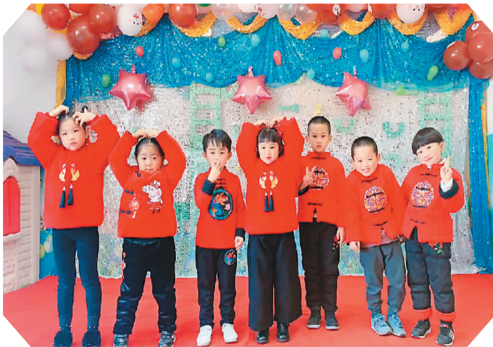
中意学校的学生参加学校组织的文化活动。

疫情发生之前，我原本计划在另一座城市开设一所新学校。但受疫情影响，这个计划只能暂时搁置。不过，我会继续办好中文学校。如今，我有了新的目标，那就是借助线上线下并行的方式，让生活在偏远地区的侨二代也能更好地学习中文。