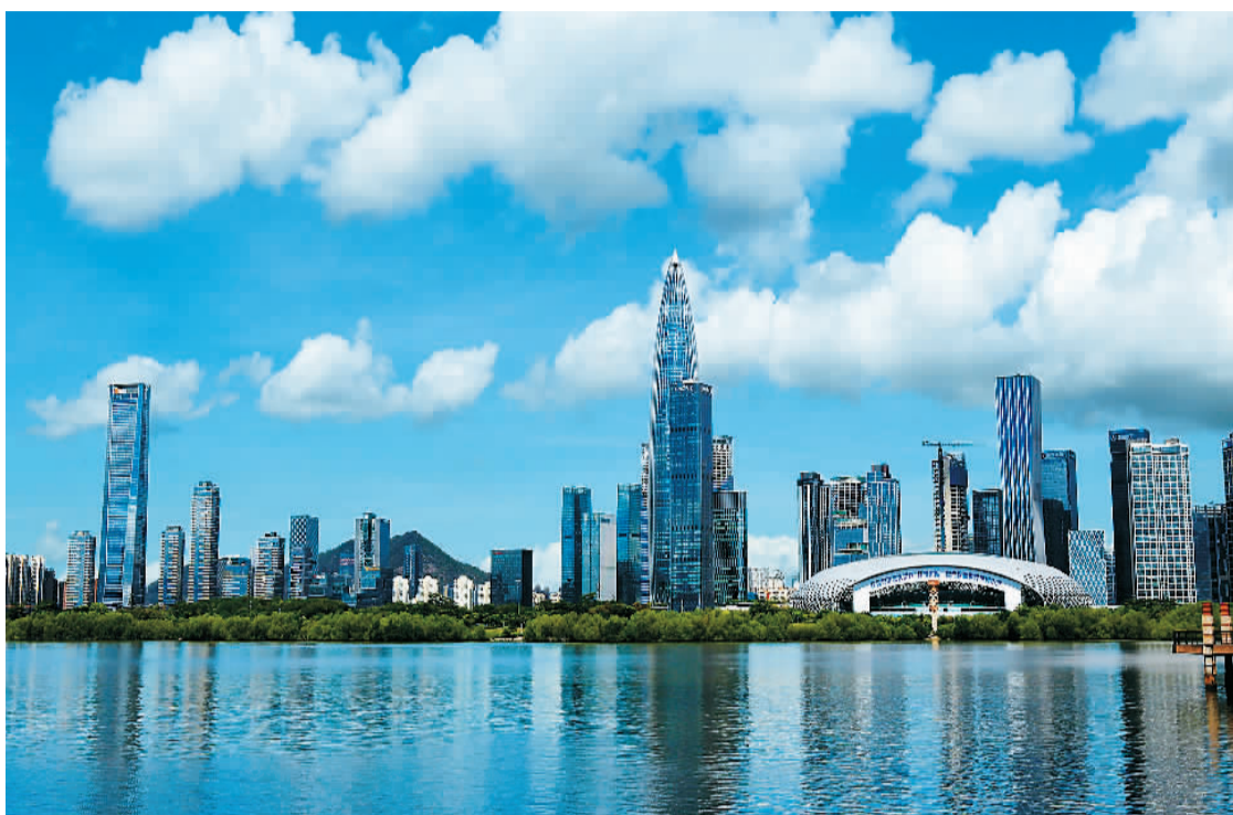
广东深圳湾公园位于深圳市福田区,地处深圳湾北岸、西岸海岸,是一处非常漂亮的滨水休闲带景观,吸引无数来自全国各地的游客前往旅游休闲。

经过多年城市发展,如今,深圳已有大大小小的公园1200多座,有“千园之城”的称号。除了遍布社区周围的社区公园,还有综合公园、郊野公园,各有特色。例如,喜爱观鸟的可以去红树林公园,喜爱赏花的可以去流花山