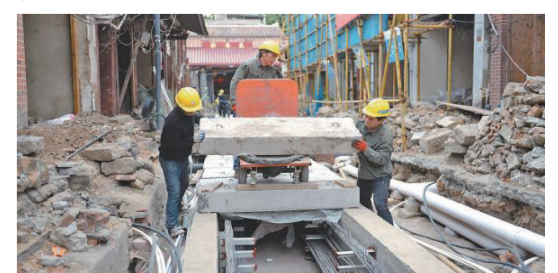
圖為興化府歷史文化街區保護修繕項目施工現場。

量保障，並通過建立“一專班一微信群、一天一會商、三天一協調、一周一調度，半月一通報”工作機制，成立大督察辦等，第一時間解決項目攻堅中遇到的難點、堵點，跟進推動項目攻堅，確保項目天天有進度、周周有進展、月月有突破，全力完成全年目標任務。(湄洲日報記者 鄭已東)