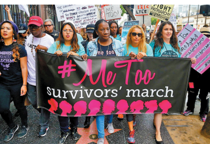
●美國的「覺醒」概念自2010年代起開始流行，意指民眾開始意識到種族和性別歧視等偏見。

日本和韓國在看待中美關係上也有不同的利益和訴求，兩國之間歷史矛盾也難以消解；印度即使在軍事防務上成為了美國盟友，但表態難認同盟友「名分」，甚至仍堅稱其「戰略自主」；東盟等國家也是在對美安全需求與對中國的經濟依賴之間努力尋求平衡；墨西哥等拉美國家更是經常被美國右翼輿論吐糟為犯罪、非法移民等，都成為諸多美內政問題的根源。可見，即使拜登努力向盟友保證要建立在共同價值觀基礎上的盟友關係，但這中間的問題清單依然很長。 ●綜合報道