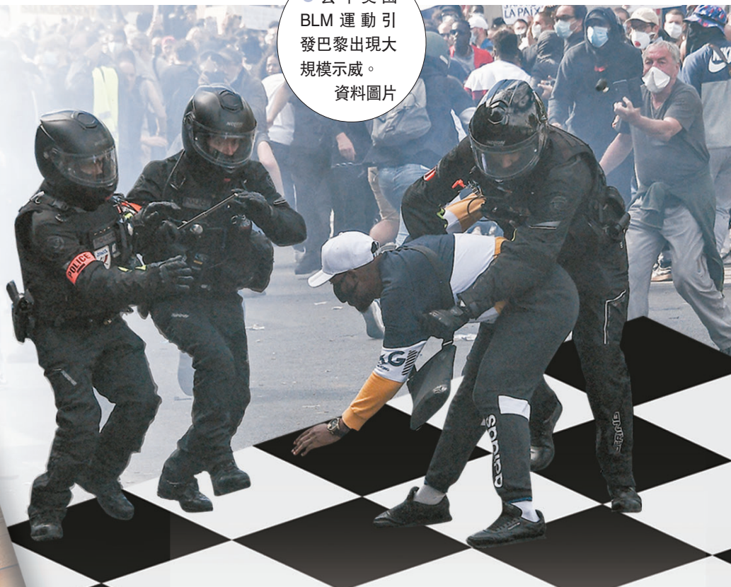
●去年美國BLM運動引發巴黎出現大規模示威。資料圖片