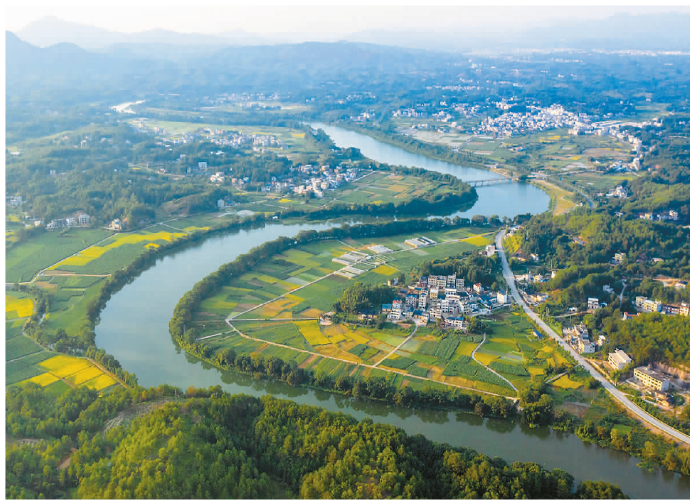
长汀汀江国家湿地公园。