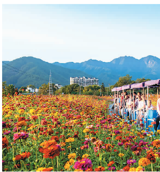
在长汀县新桥镇曲四哩的花海，游客乘坐小火车欣赏这里的美景。