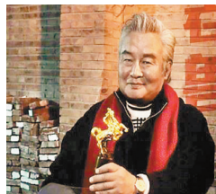
●涂們獲得第54屆金馬獎最佳男主角獎。