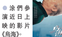
●涂們參演近日上映的影片《烏海》。

香港文匯報訊 內地資深男演員涂們2017年憑藉電影《老獸》獲得第54屆金馬獎最佳男主角獎，在近日上映的影片《烏海》中也有露面，飾演女主角的父親，惟前日傳來他因食道癌病逝，終年61歲。得知涂們去世的消息後，演員惠英紅、導演程青松、女星關清子等也發文悼念，表達不捨之情。