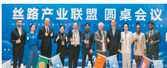
●絲綢之路國際電影節(福州)日前舉行絲路產業聯盟圓桌會議。

一項絲路產業聯盟中外影視基地合作計劃，在此次電影節上啟動。西班牙加那利群島影視基地、朝鮮平壤國際電影小鎮、中國橫店影視城等9個影視基地參與此項合作計劃，現場推介其特色文化，展開交流合作。