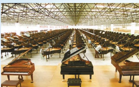
東北鋼琴廠調試車間