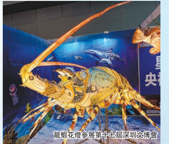
龍蝦花燈參展第十七屆深圳文博會

文化興，則國運興。文化是一個城市獨特的印記，文化產業是考量城市核心競爭力的重要指標。近年來，遼寧省營口市文化產業不斷實現自身突破，以拓荒開路之勢奮勇前行，據最新統計數據顯示，全市實現文化產業增加值為22.9億元，佔GDP比重為1.7%，分列全省第四和第五。全市現有規上文化企業21戶，其中「小升規」新晉級企業6戶，總數呈現四年來止跌反彈、逆勢上揚的良好趨勢。文/孫澎博