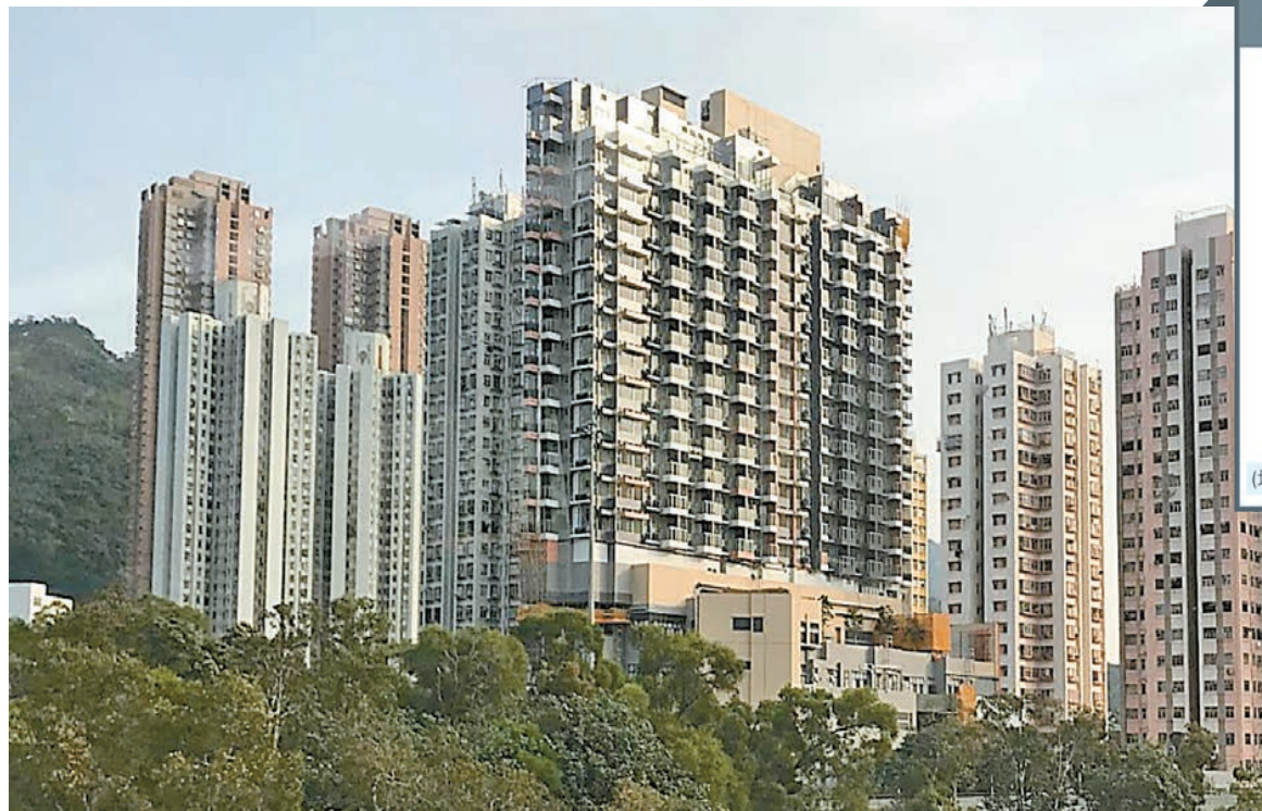
「龍床盤」屯門菁雋下調5伙位於頂層21樓特色戶的價單定價，下調幅度由6%至33%不等。資料圖片

【香港商報訊】記者周健鑫報道：上周新盤銷情稍見放緩，剛過去的周末以「龍床盤」屯門菁雋劈價再出貨最吸晴，其次以恒隆(101)九龍灣全新盤皓日周六首輪開售100伙，即日沽出78伙亦為市場焦點。二手樓市方面，成交普遍偏弱，四大地產代理二手樓成交中，兩間錄得下跌，一間無升跌，惟港置則錄得12宗成交。