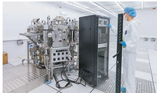
多腔聯動星型式真空蒸鍍機。