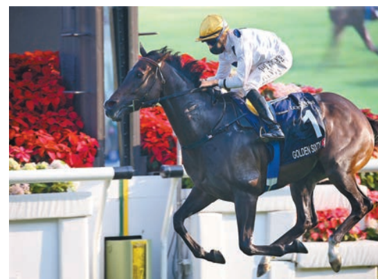
「金鎗六十」成功衛冕浪琴表香港一哩錦標。

資源支持產業化，也難以找到投資。他認為，雖然特區政府推出不少措施推動創科發展，但產業化資源不足的問題有待解決。【港創科 創科港】由本報和京港學術交流中心合作推出