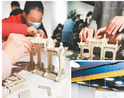
图①：市民手工制作牌楼。 图②：孩子们在老师指导下，用肢体演绎钟鼓楼。

手工制作北京城牌楼、用戏剧演绎钟鼓楼等建筑、听专家讲解中轴线的历史变迁……12月4日，由北京市文物局和北京中轴线申遗保护工作办公室主办的“魅力北京 大美中轴”系列活动在美后肆时景山市民文化中心启动。