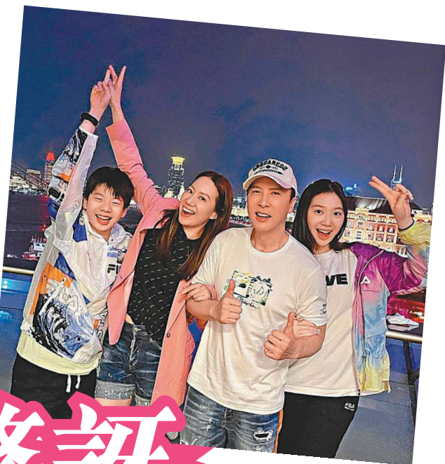
●甄子丹表明將陪伴家人慶祝聖誕新年及農曆年。網上圖片

子丹為《殺神4》開工拍了4個多月，他表示很開心與荷里活影星奇洛李維斯合作，說：「他為人很好，我們以前在香港的慈善活動中已認識，今次可以更加深入地一齊工作、做好朋友。」回港後的子丹笑言要忙陪家人，太太汪詩詩直言今次子丹去拍戲是他們分開最久的一次，連隔離時間足足有半年沒見面，子丹解釋今年先後拍了兩部片，除《殺神4》外也要到長白山拍戲3個月。他說：「現在可以盡情陪家人及仔女，今次返來兒子已經變聲，離港前他仍未變聲，現在已跟我一樣高，女兒更已經高過我，幸好我們沒有疏離，關係仍很親密，只是我不慣和不捨得兒子變聲。」笑問子女長大是否已開始拍拖，子丹笑稱子女感情事要交給太太處理，汪詩詩說：「他們好乖，兒子仍好單純，像個BB。」子丹直認之前忙拍戲的確少了與家人相聚的時間，他也有反省是否要減少工作，詩詩就笑指他是工作狂，每天都有很多會議要開，子丹解釋道：「因為仍有很多套戲，雖然想停一停，但又好難停，最快明年4月出埠拍戲，都可以在香港過聖誕和過年，難得今年詩詩的婆婆來港，到時可以四代同堂慶祝。」