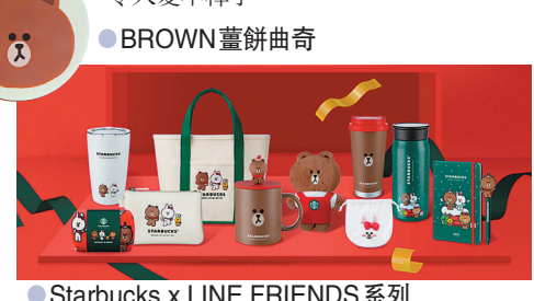
● Starbucks x LINE FRIENDS 系列