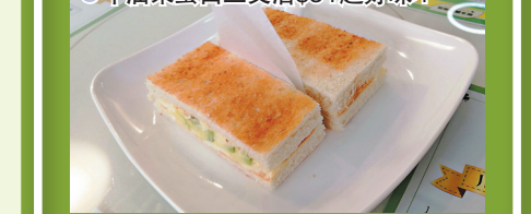
● 牛油果蛋白三文治 $34 超好味！