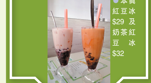
● 本真紅豆冰 $29 及奶茶紅豆冰 $32