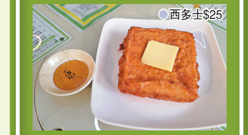
● 西多士 $25