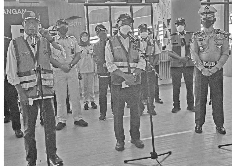
当局将在年底假期实施交通管制 人力资源建设与文化统筹部长穆哈吉尔·艾芬迪(Muhadjir Effendy/中)在交通部长苏马迪(Budi KaryaSumadi/左)及警察交通事务系统主任费尔曼(Firman-Shantyabudi/右)的陪同下，于12月11日在万丹省芝勒贡(Cilegon)孔雀港(PelabuhanMerak)，向码头工作人员发出指示，并视察圣诞节及新年期间管制交通的准备事项。