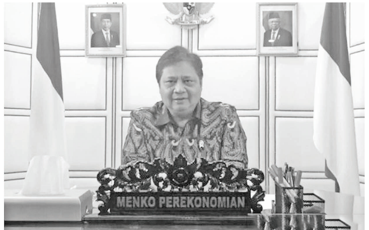
2022年将是经济持续复苏时期 上周末，经济统筹部长艾明卡·哈达托(Airlangga Hartarto)在一项记者会上声称，2022年将是经济持续复苏的时期。

也是重要的事项。”贝利称，要快速推行的第二件事就是数字生态系统的完善，如数字化银行、金融业科技，这一切都是不能分割的电子商务。至于金融业科技不能单独增长，因此必须与最大行业之一的数字银行合作，再说金融业科技在没有电子商务的协助下，无法进入庞大的数字市场。