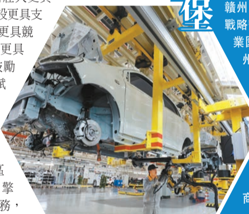
國機智駿汽車有限公司生產線

「工業是贛州發展的突出短板。要始終堅持主攻工業，做強龍頭、做大規模、做響品牌、做活營銷，挺起高質量跨越式發展的脊梁。」贛州市第六次黨代會指出，贛州將壯大更具影響力的產業集群，建設更具支撐力的園區平台，培育更具競爭力的龍頭企業，發展更具帶動力的數字經濟，鼓勵引導各地立足資源稟賦發展首位產業，形成區域協同、互相配套、錯位發展的產業布局，賦予開發區更多自主權，真正發揮開發區主平台、主戰場、主引擎作用。持續優化精準服務，高效落實各項惠企政策，讓企業在贛州順心舒心安心發展。