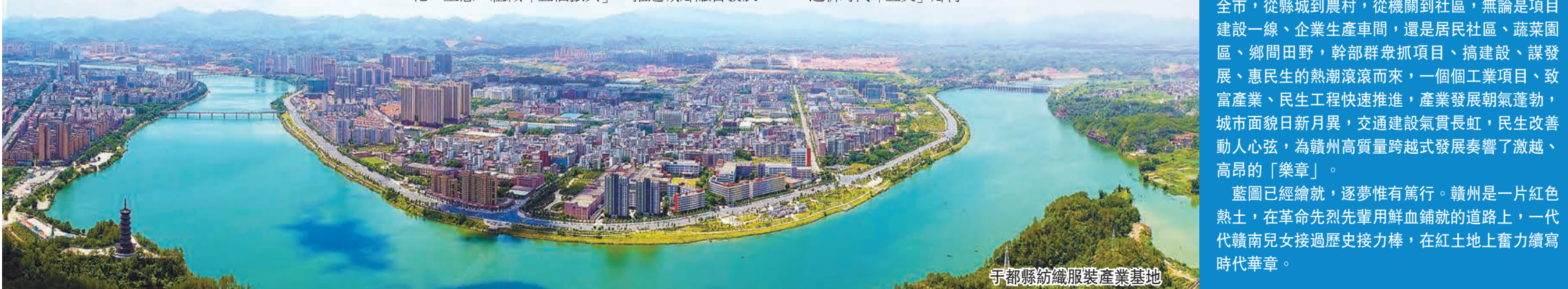
于都縣紡織服裝產業基地