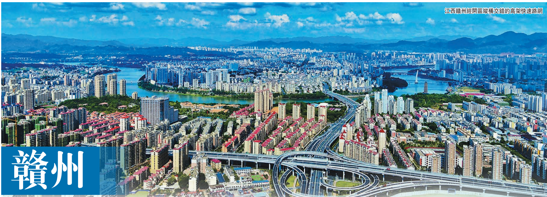
江西贛州經開區縱橫交錯的高架快速路網