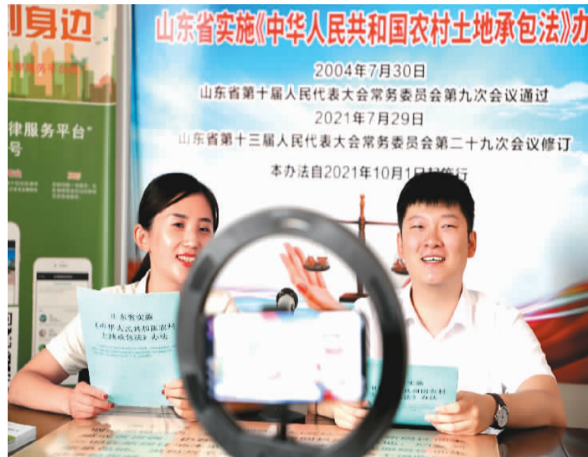
山东省东营市东营区黄河路街道司法所运用网络平台普及《山东省实施〈中华人民共和国农村土地承包法〉办法》知识。

事”通过风趣幽默的普法短视频，吸引1600余万粉丝，成“破圈网红”；中国普法微信公众号总订阅读人数已经突破2100万，累计发文1.8万余篇，总阅读量超过10亿人次；“国家反诈中心”客户端成为网民日常提起的“热词”……各式各样的网络平台将法律知识送到网民的屏幕上、指尖上，增强了普法活动的趣味性和参与感，达到更好的普法宣传教育效果。