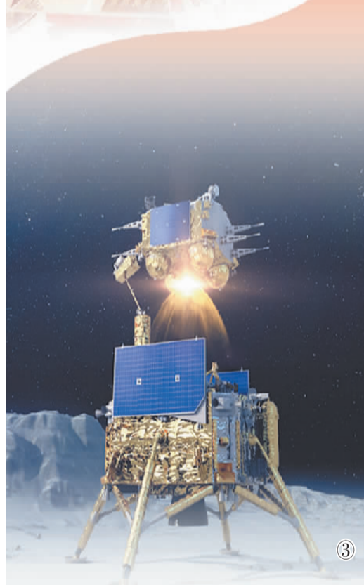
图①：嫦娥四号着陆器。国家航天局供图 图②：国家“十三五”科技创新成就展上展出的月球样品。刘淮宇摄 图③：嫦娥五号着陆器和上升器组合体月面工作示意图。国家航天局供图 图④：玉兔二号在月背行走。国家航天局供图