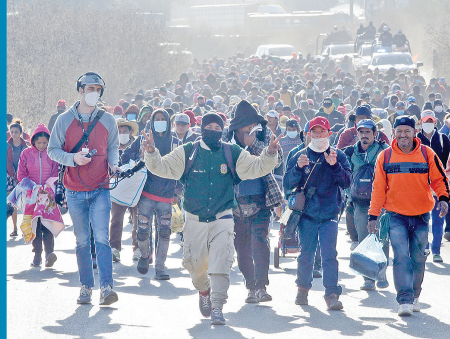
拉美移民在路上 12月9日,在墨西哥普埃布拉,试图北上前往美国的移民走在一条公路上。