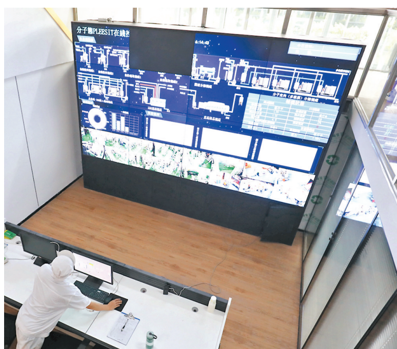
●落戶橫琴的中醫藥健康產業項目生產車間自動控制室。

同時，合作區與全國多家頂級專業半導體投資機構合作，引進芯耀輝科技、極海半導體、芯潮流科技、集創北方、芯動科技等一批集成電路設