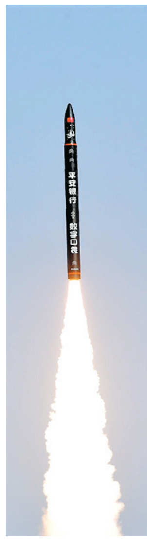
●雲遙宇航成功發射「天津大學一號」衛星。

星平台和載荷設計的合理性和可靠性進行在軌驗證，為後續業務星的批量生產奠定技術基礎，相信將為我國經濟建設提供實時性優於20min的地震短臨預報信息及氣象預報信息，增強我國的國際影響力。」雲遙宇航相關負責人說。